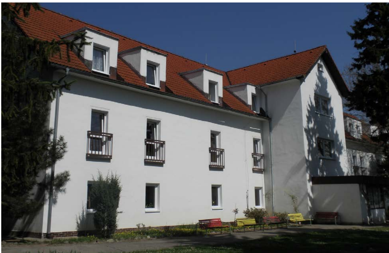
budova v Modre – Kráľovej - súpisné číslo 1480 (parcelné číslo 3210/2,3,6) :